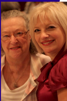
La grande famille des personnes agées seules